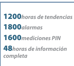
Enorme capacidad de datos