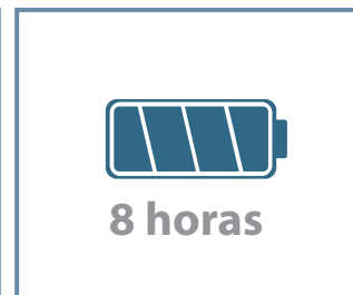
Batería de larga duración